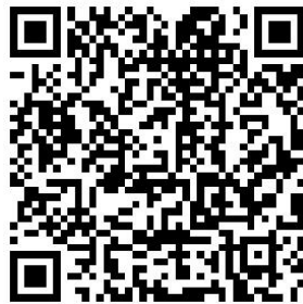
（会议报名系统二维码）

1. 请于 2023 年 4 月 17 日（星期一）下午 17:00 前扫描以下二维码进行报名，并电话确认报名信息提交成功；